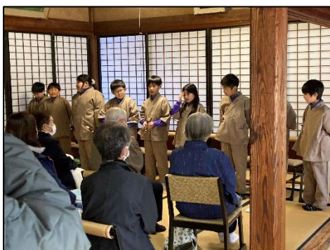
4年：珍藏寺での語りの会