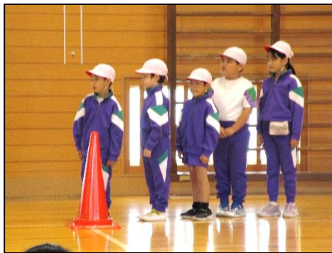
1・2年 体育の学習から