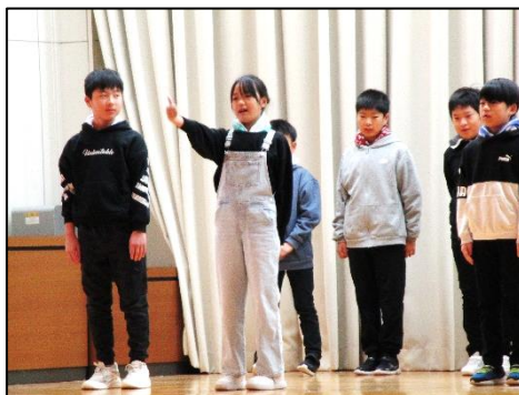
5年：米作りの学習から