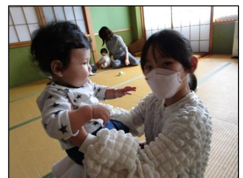
6年：福祉の学習の様子