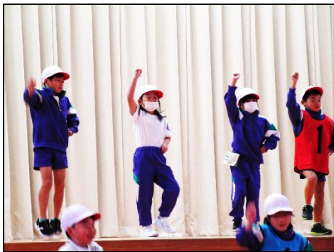
1・2年 体育の学習から

体育に国語、そして総合的な学習の時間に学んだことのまとめなど、どの学年も普段の学習の成果を工夫を凝らした発表にまとめました。「全校生や、おうちの方に見てもらいたい」ということが、日々の学習の意欲にもつながりました。4年生は珍藏寺で語りの会を開いたり、5年生は米作りの先生をお招きして感謝の会をしたりと、発表の機会も広がっています。