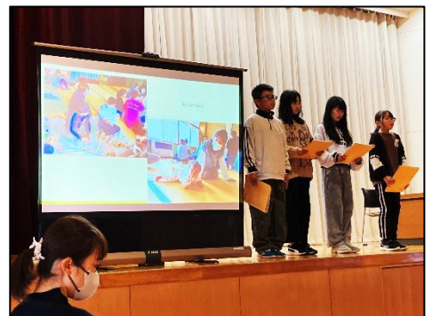
6年：福祉の学習から