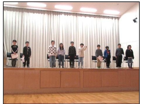
3年：朗読劇「ちいちゃんのかげおくり」