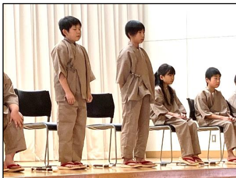
4年：語り「鶴の恩返し」